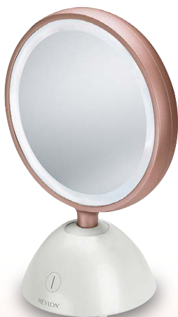
フェイシャル ビューティーマirror RVMR9029J