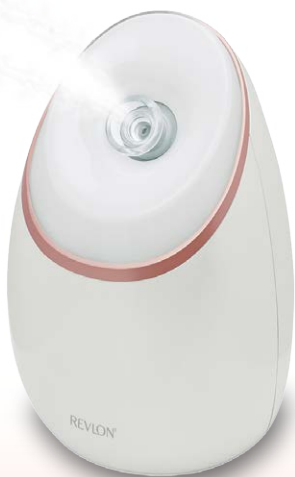
フェイシャル ビューティースチーマー RVSP3537J